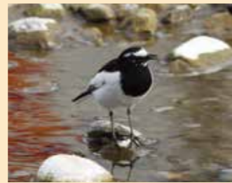
セグロセキレイ 全長約20cm

白い顔に黒い線が特徴。頭から肩、背にかけて黒色または灰色。チン、チンと鳴く。水辺の昆虫や水生昆虫を食べる。