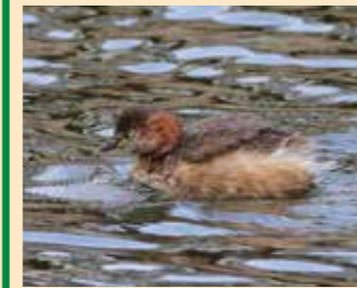
カイツブリ 全長約25cm

全身茶色の水鳥。水に潜って水生昆虫や小魚を捕食するほか、外敵から身を守る手段として頻りに水に潜る。浮巣を作る。