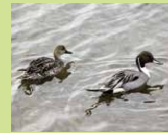
オナガガモ 全長 雄約75cm 雌約55cm

雄は頭頂部が黄色で首から上が茶色をしている。雌は地味な茶褐色。主に水に浮かぶ植物などを食べる。ピューイと鳴く。