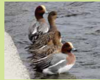
ヒドリガモ 全長約50cm

カモの仲間では最小。雄は茶色の頭に緑の帯がある。雌は他のカモと同様に雛を育てるため、地味な色をしている。