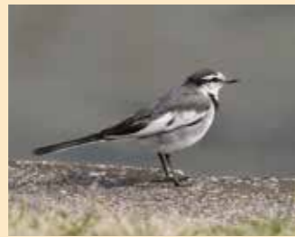
ハクセキレイ 全長約20cm

白い顔に黒い線が特徴。頭から肩、背にかけて黒色または灰色。チン、チンと鳴く。水辺の昆虫や水生昆虫を食べる。