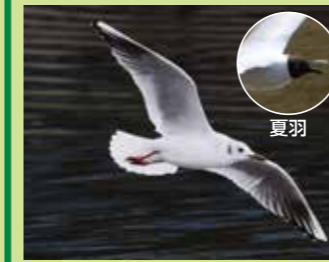
ユリカモメ 全長約40cm

足とくちばしが赤い雑食性の小型カモメ。餌を求めて海から川の上流まで移動する。4月頃から頭部が黒くなる(夏羽)。